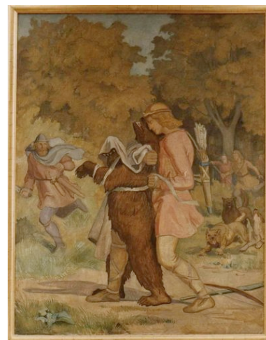
Skjold og Bjørnen

Lorenz Frölich - som historiefrembringer og kunstner.