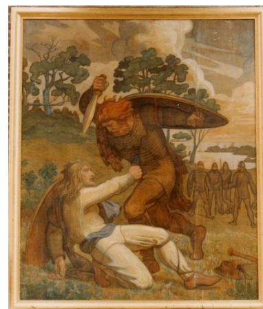
Hjalmar og Agantyr

sammenligninger med andre grafikeres illustrationer i Fabricius: disse står, efter klassisk forbillede, hvilket især gælder Constantin Hansens, i positur, eller også leger de for tidsfordriv. Når derimod Rolf og hans mænd springer over ilden , tager de hele rummet i besiddelse, idet de udgør en dynamisk diagonal op mod de flygtende brandstiftere i øverste venstre hjørne. I Bråvalla-slaget presses fjender ud i hjørnet af heste og vogn, så kampen truer med at springe billedets forgrund. På denne måde involveres beskueren aktivt. Denne pågående kompositionsform yndede Frölich, og han gentager den bl. a. i Gefion ved udsmykningen på Fredensborg .