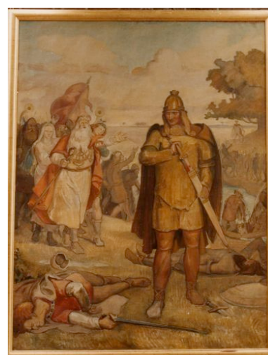
Uffes kamp med Sachserne